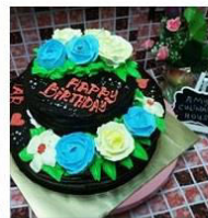
WEDDING CAKE 2016 1 Post