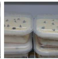
KEK KEJU LELEH by Amy culina... 10 Posts