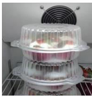
PAVLOVA by Amy Culinary Hou... 4 Posts