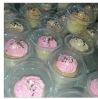
CUPCAKES by Amy Culinary Ho... 3 Posts