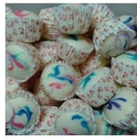
APAM POLKADOT & MEKAR by ... 3 Posts