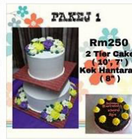
PAKEJ KEK PERKAHWINAN & HA... 1 Post