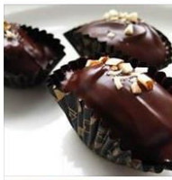
TEMPAHAN RAYA 2015 3 Posts