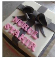
FONDANT CAKE by Amy Culina... 1 Post