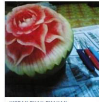
UKIRAN BUAH-BUAHAN 7 Posts