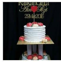
TEMPAHAN HARI RAYA AIDILAD... 1 Post