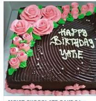
MOIST CHOCOLATE CAKE 2 by ... 2 Posts