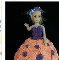
BARBIE DOLL CAKE by Amy Cul... 2 Posts