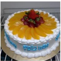
FRUIT FLAN CAKE 2 Posts