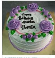
BUTTERCREAM CAKES by Amy ... 2 Posts