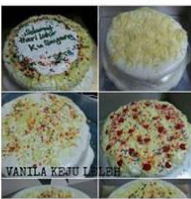
KEK PROMOSI ULANGTAHUN KE... 1 Post