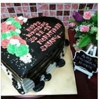
KEK FRESH CREAM / KEK AISKRIM 1 Post