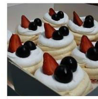
PAVLOVA / MINI PAVLOVA 1 Post