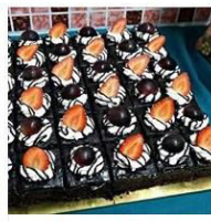
SLICE CHOCOLATE CAKE 1 Post