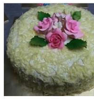
KEK KEJU LELEH 2016 1 Post