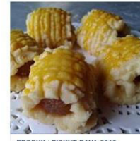
PRODUK / BISKUT RAYA 2016 1 Post