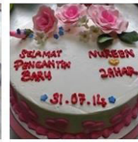
WEDDING & ENGAGEMENT CAKE... 9 Posts