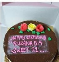
KEK TIRAMISU 1 Post