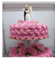
Ztier / 3tier Cake by Amy Culin... 4 Posts